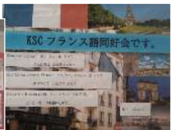
ふれあいホールにはたくさんの力作を展示！