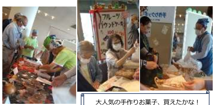
大人気の手作りお菓子、買えたかな！