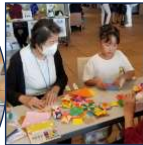
上手に折り紙できたかな！