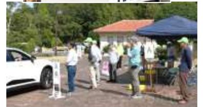
縁の下の力持ち、一日お疲れさま！