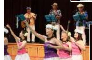
アロハワイアンズ