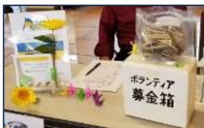
たくさんの募金をありがとう！