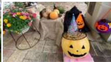
中庭では、お花や野菜を販売中