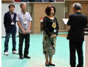
キャッチフレーズ表彰式