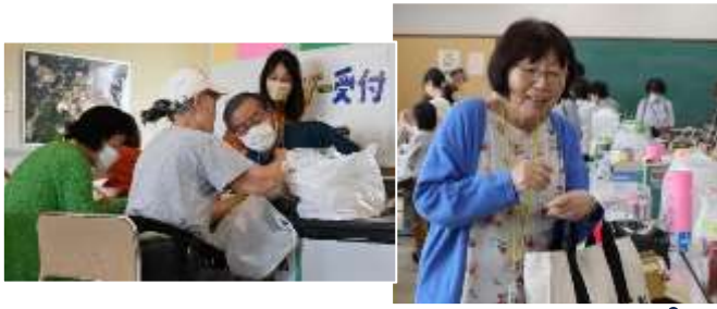
バザーは学園祭の目玉の一つ、会場は超満員