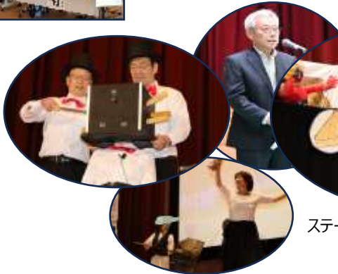
ステージは人形劇から始まりました