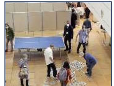
各委員会、支援者の皆さまお疲れさまでした