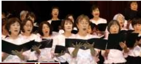
混声合唱団 コーロ KSC