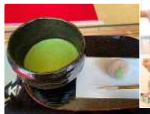
昔遊びなど、いろんな体験を楽しみました！